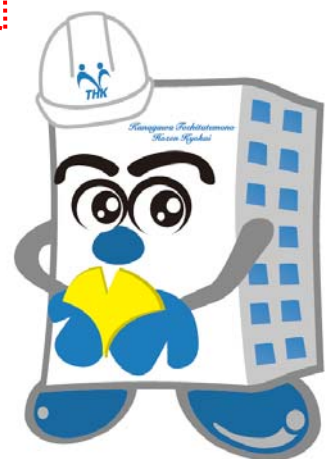
マスコットキャラクター ほぜんくん